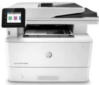
HP LaserJet Pro MFP M428fdn

Geschäftlich erfolgreich zu sein bedeutet, smarter zu arbeiten. Der HP LaserJet Pro MFP M428 ist dafür konzipiert, dass Sie Ihre Zeit dort einsetzen können, wo Sie die höchste Effektivität erzielen – Ihr Geschäft ausbauen können und Ihren Vorsprung vor der Konkurrenz sichern können.