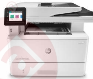
HP LaserJet Pro MFP M428fdw

Dynamic-Security-fähiger Drucker. Ausschließlich für die Verwendung mit Patronen mit Original HP Chip vorgesehen. Patronen mit Chips anderer Hersteller funktionieren möglicherweise nicht oder in Zukunft nicht mehr. Weitere Informationen unter: