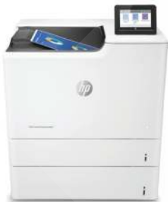
HP Color LaserJet Enterprise M653x