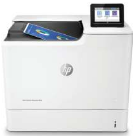
HP Color LaserJet Enterprise M653dn

Dieser HP Colour LaserJet-Drucker mit JetIntelligence kombiniert außergewöhnliche Leistung und Energieeffizienz mit Dokumenten in professioneller Druckqualität zum richtigen Zeitpunkt – Ihr Netzwerk bleibt dabei durch die branchenweit umfassendsten Sicherheitsfunktionen geschützt. 1