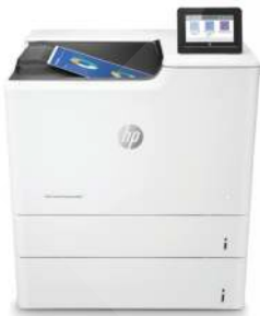
HP Color LaserJet Enterprise M653x